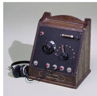
国産第1号鉱石ラジオ