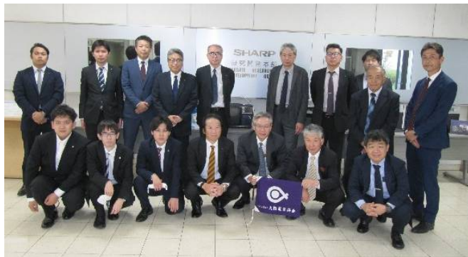
参加された 17 名の皆さん

会員企業見学会は、資材製品に関する理解を深めるとともに電気に関連する施設を見学することで幅広い知識を習得することを目的として、1993（平成 5）年に、明治ナショナル工業株式会社様（春日工場）、三菱電線工場株式会社様（伊丹製作所）を見学したのが始まりで、昨年 11 月には第 29 回目となる見学会として奈良県天理市にある「シャープミュージアム」を見学しました。