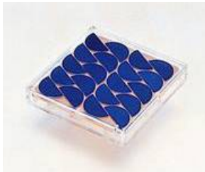
太陽電池モジュール

いち早く製品化し、大きなシェアを持つ「太陽電池」の生産過程を原料から実物で見ることができました。