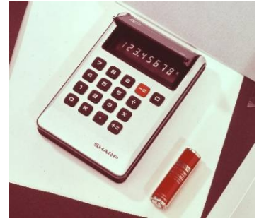
液晶表示付き電卓

また「ポケコン」、「電子手帳」、携帯端末「ザウルス」など当時の先端製品が並んでいました。