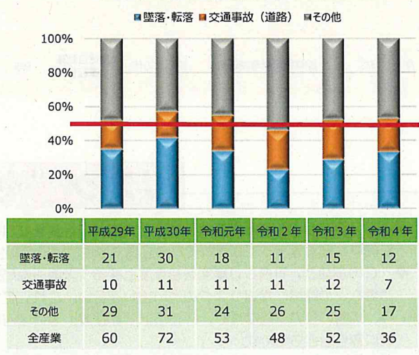
死亡総数に対する墜落・転落災害&交通事故の割合

※令和2年、令和3年、令和4年は、新型コロナウイルス感染症によるものを除く 令和4年は、1~11月末までの累計で速報値